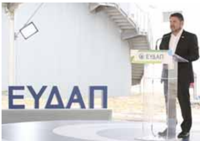
Ο Περιφερειάρχης Αττικής Ν. Χαρδαλιάς

Εγκαινιάσθηκε, Τρίτη 23 Απριλίου 2024, το νέο Κέντρο Επεξεργασίας Λυμάτων Κορωπίου – Παιανίας (ΚΕΛΚΠ), από τον Περιφερειάρχη Αττικής Νίκο Χαρδαλιά , τον Πρόεδρο του Διοικητικού Συμβουλίου της ΕΥΔΑΠ Γιώργο Στεργίου και τον Διευθύνοντα Σύμβουλο της Εταιρείας Χάρη Σαχίνη παρουσία των Δημάρχων Κρωπίας και Παιανίας, Δημήτριου Κιούση και Ισίδωρου Μάδη και της Αντιπεριφερειάρχου Ανατολικής Αττικής Βίκυς Καβαλλάρη .